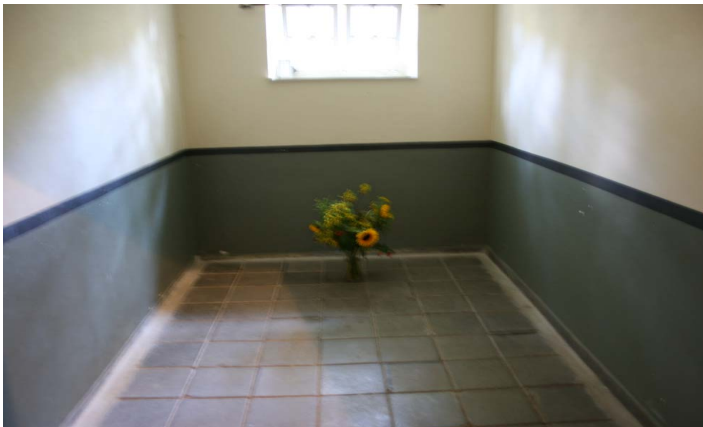
Locale crematorio cella 115 o bunker

Durante la notte tra il 15 e 16 Gennaio 1944, per punizione, 74 donne furono imprigionate nella cella bunker di soli 9 mq. senza ventilazione e costrette a stare in piedi per un periodo di 14 ore. Il mattino dopo 10 donne furono trovate morte per mancanza di ossigeno. I loro nomi si possono leggere su una targa appesa alla parete.